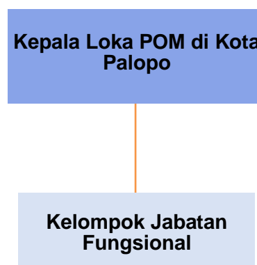
Gambar 1. Struktur Organisasi Loka POM di Kota Palopo

Struktur Organisasi dan Tata Kerja Loka POM di Kota Palopo disusun berdasarkan Peraturan Badan Pengawas Obat dan Makanan Nomor 23 Tahun 2021 tentang Perubahan atas Peraturan Badan Pengawas Obat dan Makanan Nomor 22 Tahun 2020 tentang Organisasi dan Tata Kerja Unit Pelaksana Teknis di Lingkungan Badan Pengawas Obat dan Makanan. Berikut ini merupakan bagan struktur organisasi Loka POM di Kota Palopo: