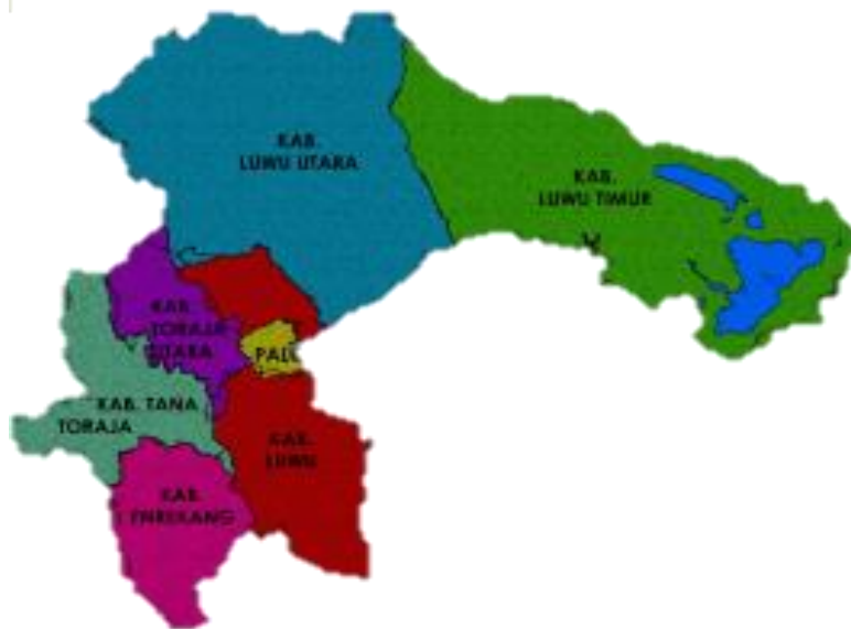
Gambar 2. Peta Wilayah Pengawasan Loka POM di Kota Palopo